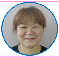
本園フリー 系数 静香